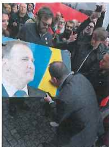
Partiledare och autografskrivare