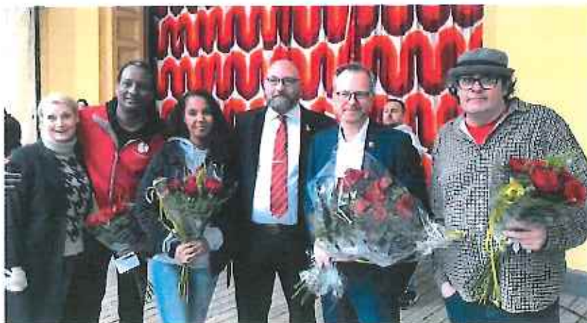
Talare och arrangörer vid Första maj-firandet.

Vid årets Första maj blev firandet lika lyckat som vädret var dåligt. Med start klockan 09.00 samlades ung och gammal på partiexpeditionen för att fika och ladda upp inför årets tåg och inte ens snålåsten kunde hindra de ca 200 i tåget som tillsammans med veteranbussen och inrikesminister Mikael Damberg tågade upp till Sundspärlan.