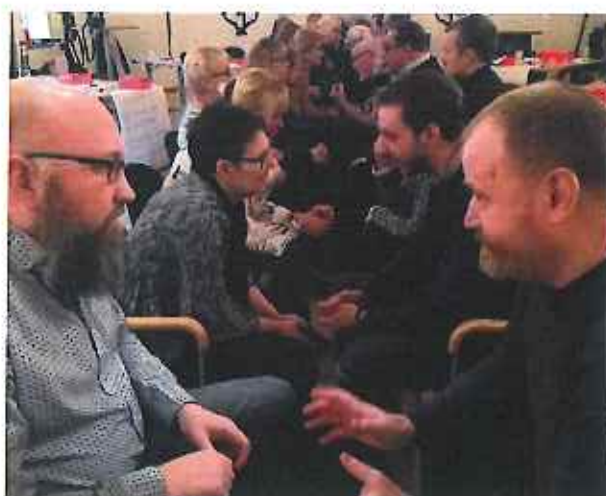
En bild från internatet som fullmäktigegruppen inledde året med

Det finns med andra ord mycket att vara stolt över under år 2019. Den kanske största vinsten av alla är att tecknen på att allt fler blir allt tröttare på den nyliberalistiska idén som lett till så många utförsäljningar av våra gemensamma tillgångar. Vi tar med oss den goda känslan av att vi är på rätt spår i politiken och att vi har medvind i opinionen. Kampen för ett jämlikt, jämställt och klimatsmart Helsingborg fortsätter. Det går bra nu.