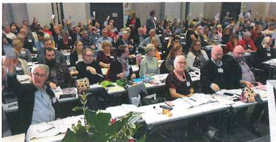
Glada ombud från Helsingborg på främre raden